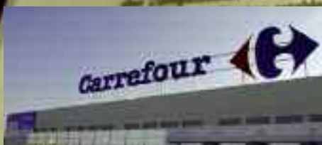
Jornadas de los productos tradicionales en Carrefour