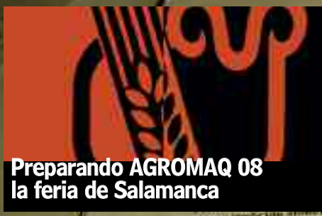
Preparando AGROMAQ 08 la feria de Salamanca