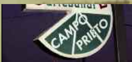
Artesano del mes: quesería Campo prieto